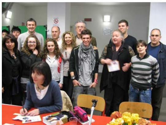
Alcuni momenti dell'incontro della scrittrice con i ragazzi e gli insegnanti